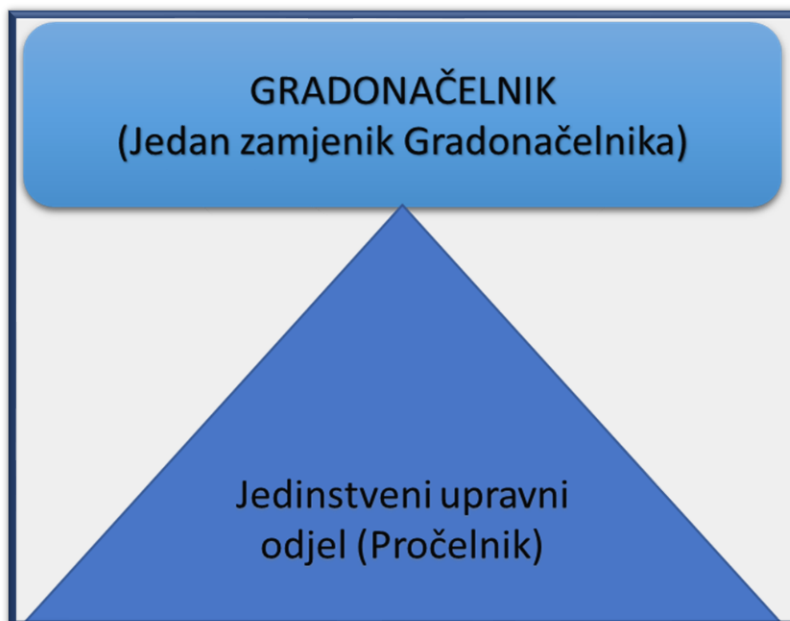
Slika 2. Ustrojstvo Grada Hrvatske Kostajnice