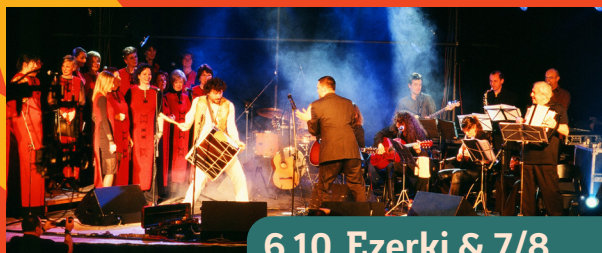
6.10. Ezerki & 7/8

Aktivnosti za sve generacije | Bogati sadržaji za djecu | Gastronomija i Eko Sajmovi