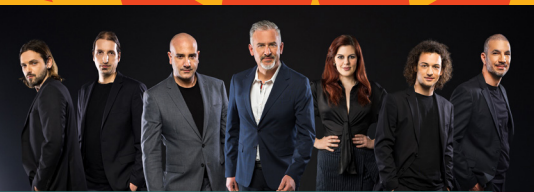
4.10. Giuliano & bend Diktatori